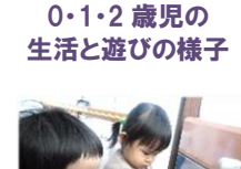
0・1・2 歳児の 生活と遊びの様子