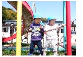
本館所庭 (こあら組)