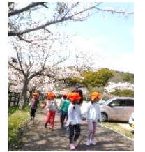
散歩(愛宕山) (ぞう組)