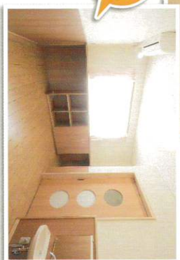
各部屋 2部屋ずつ あります。