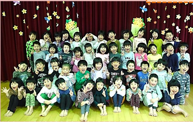
ぞう組になる日を、ワクワクしながら待っていた子どもたちです。 保育所の年長児として張りきっています！