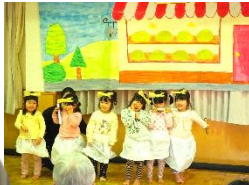
5歳児エンディング