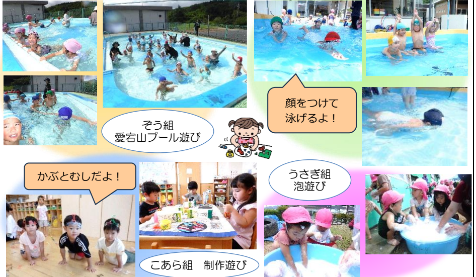
ばんだ組 プール遊び