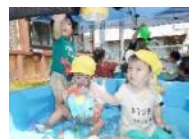
ひよこ組 寒天・氷遊び プール遊び